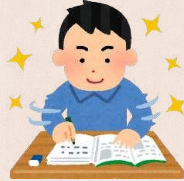
Kendi stratejini belirle